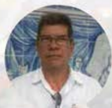
Marina do Rosário Salvador - BA

“Há uns quatro anos tive um problema na perna jogando bola. Levei uma pancada, ralou, inchou e inflamou. Pedi ao Senhor do Bonfim pela melhora e Ele me atendeu. Para agradecer peguei uma perna de cera e coloquei na Sala dos Milagres”.